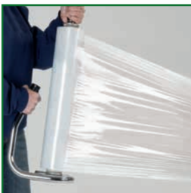
leichte Handhabung durch geringes Gewicht