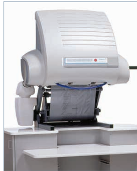
auch als Bench Top-Variante erhältlich

Klicken oder scannen Sie den QR-Code für Infos zum Produkt und Ansprechpartner in Ihrer Nähe.