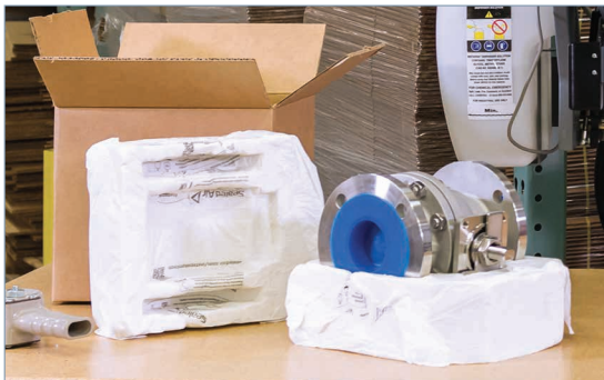
individuell geformter Produktschutz