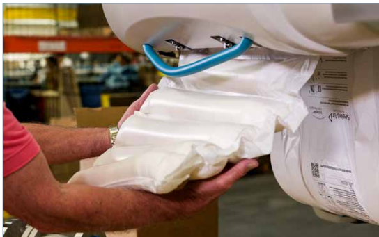
Geschwindigkeit: bis zu 21 Stk./min