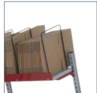
Ablage mit 20° Neigung