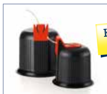
Kordelkapsel auf Anfrage