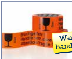
Warnklebeband Seite 126