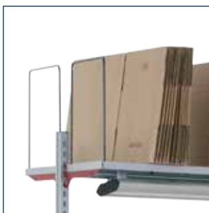
Ablage mit unterseitiger Leuchte