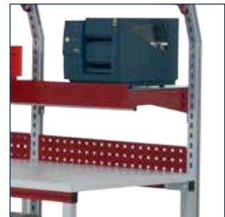
Regal mit Etikettendrucker