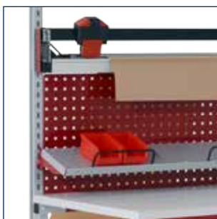
Schneidvorrichtung in Griffhöhe