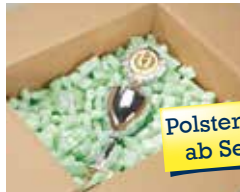
Polstermaterial ab Seite 104