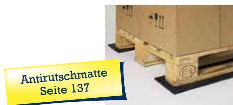
Antirutschmatte Seite 137