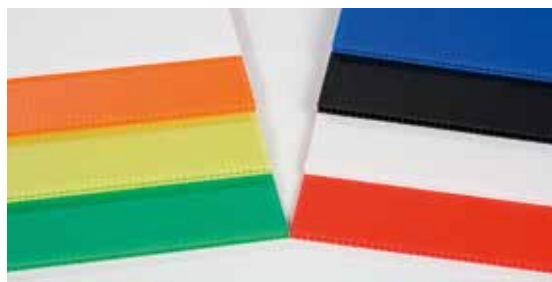
breite Auswahl an Farben