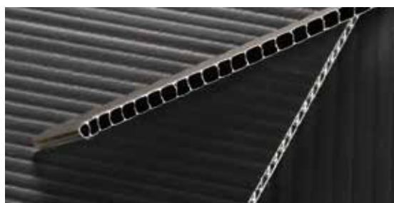
in verschiedenen Strukturen verfügbar