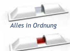
Alles in Ordnung