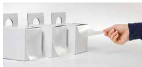
praktisch im Spenderkarton