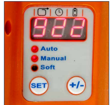
Anzeige der Einstellungen (Spannkraft, Verschweißzeit, Akku-Ladestand)